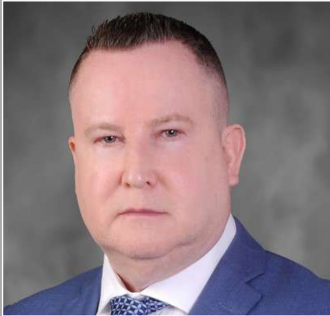
جون ريسون الرئيس التنفيذي

لا يزال التميز في الحوكمة يمثل قيمة أساسية لشركة باسرك، وفي عام التغيير هذا، جنينا فوائد الحفاظ على إطار استراتيجي قوي ومجلس إدارة متخصص ومستعد جيداً وسريع الاستجابة. ويمكن رؤية التأثيرات في نتائج أدائنا القوية وفي التنفيذ الفعال لإعادة هيكلة شركتنا على مدار العام.