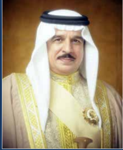
صاحب الجلالة الملك حمد بن عيسى آل خليفة ملك مملكة البحرين المعظم