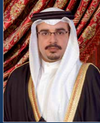
صاحب السمو الملكي الأمير سلمان بن حمد آل خليفة ولي العهد الأمين نائب القائد الأعلى ورئيس الوزراء